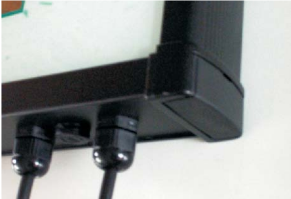
Eckstück des Rahmengerätes mit eingesetztem Abdeckwinkel

Eckstück mit eingesetzter Wandlasche zur einfachen Befestigung direkt an der Wand.