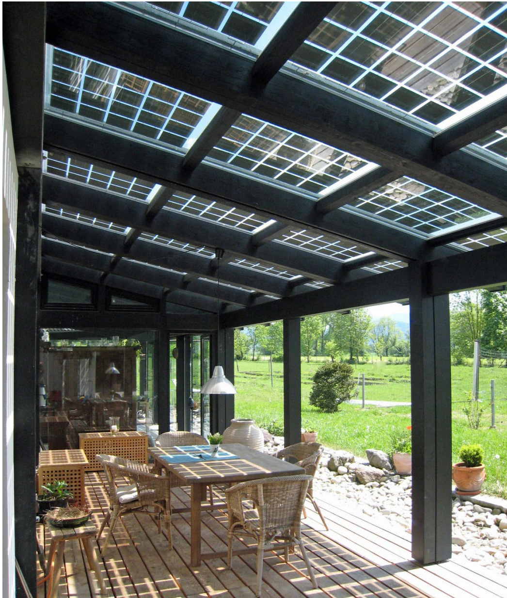
Terrassensystem: alles aus einer Hand Spendet Schatten, erzeugt Strom