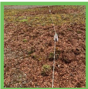
Seilanlage auf Substrat EN795 Tvp C