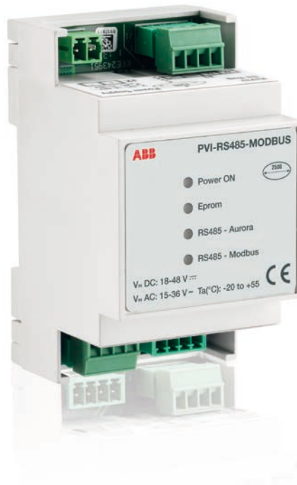
ABB Überwachung und Kommunikation PVI-RS485-MODBUS

Mit dem PVI-RS485-Modbus Konverter kann das Aurora Protocol zum Modbus RTU oder Modbus TCP Kommunikationsprotokoll umgewandelt werden.