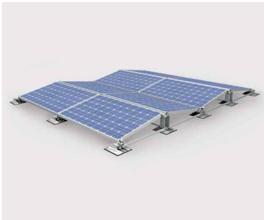
Le prémontage rapide économise des étapes de travail lors du montage.